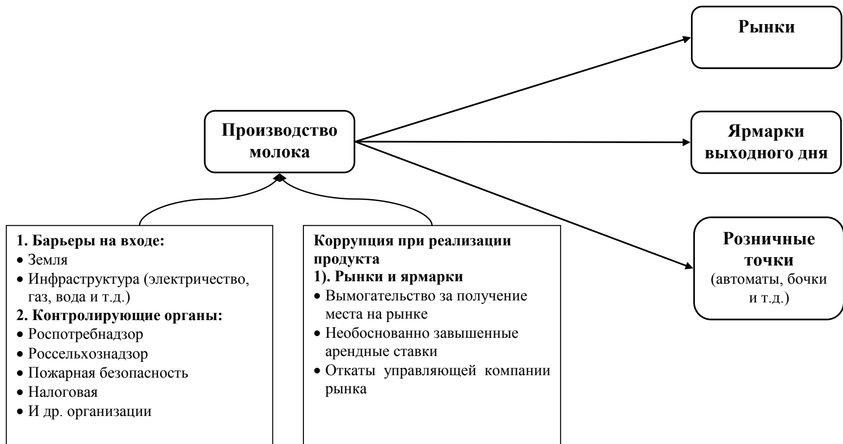
Рисунок 2. Коррупционные риски и другие дополнительные издержки в производственной цепочке молока для российских компаний «Совместное производство и переработка – Розница»